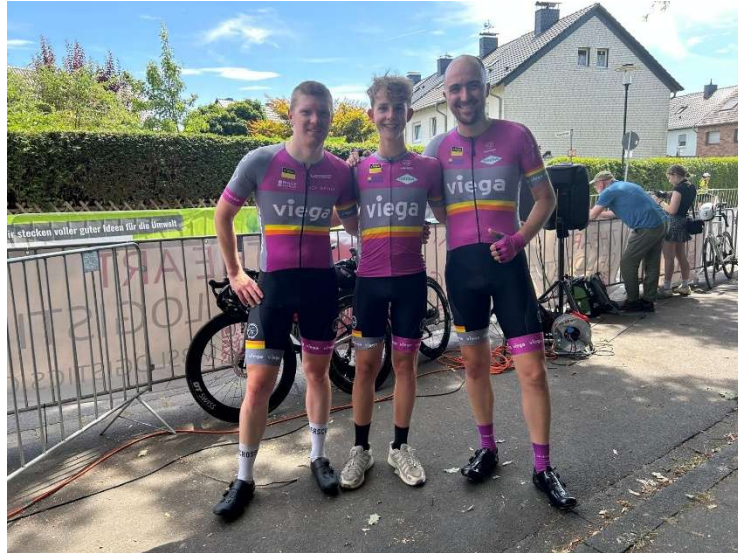
Rund in Spich