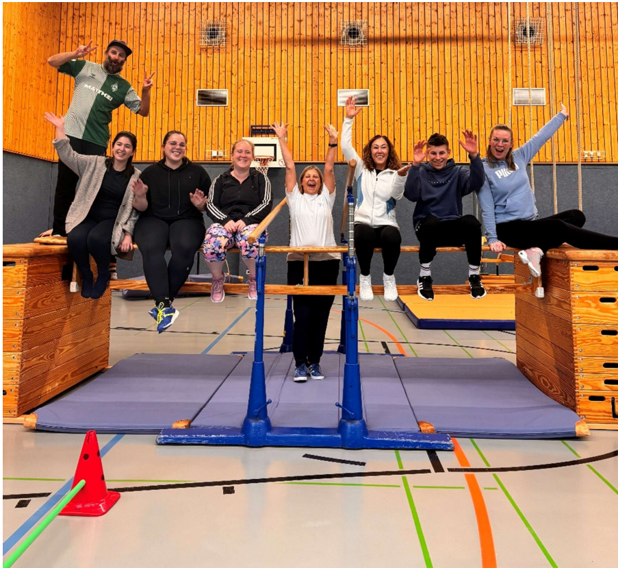
Das Team „Sporteln mit Papa“