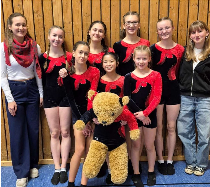
Teilnehmerinnen und Kampfrichterinnen des TV Attendorn beim Bezirksschülerinnen Wettkampf.