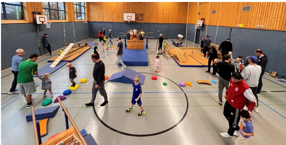
Bewegungslandschaft „Sporteln mit Papa“

Dieses Angebot findet schon seit einigen Jahren statt und erfreut jedes Mal Kinder und ihre männliche Begleitung. Für die Unterstützung bei Vorbereitung und Durchführung sage ich allen beteiligten Übungsleiterinnen und Helfer*innen und auch den Erzieherinnen der Kindergärten herzlichen Dank. Auch dieses wäre ohne eure Hilfe nicht möglich.