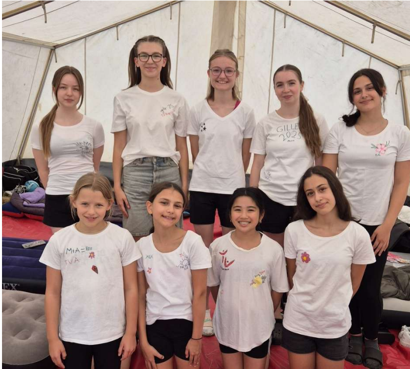
alle Teilnehmerinnen des TV Attendorn beim Gillerberg Turnfest